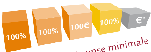
Formule 1 : la réponse minimale